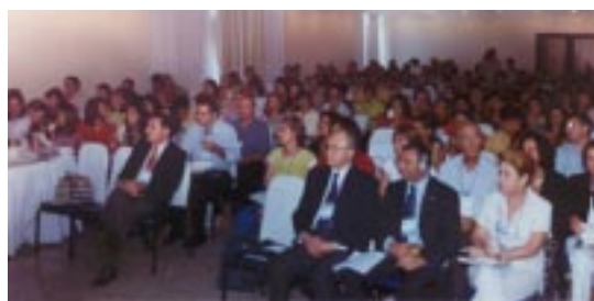
XVIII Congresso de Cardiologia Pediátrica - Recife

Dois importantes eventos nas áreas de Pneumologia e Cardiologia movimentaram os médicos brasileiros em novembro e contaram com a participação ativa da Actelion, dentro da política da empresa de promover o encontro de médicos e pesquisadores brasileiros com especialistas oriundos de renomados centros de referência no tratamento da Hipertensão Arterial Pulmonar (HAP).