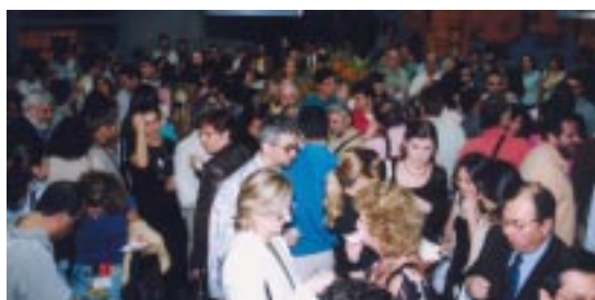
X Congresso Paulista de Pneumologia e Tisiologia - São Paulo